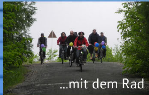
...mit dem Rad