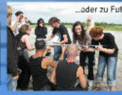
...oder zu Fuß