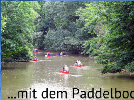
...mit dem Paddelboot