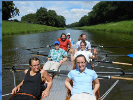
...mit dem Ruderkatamaran