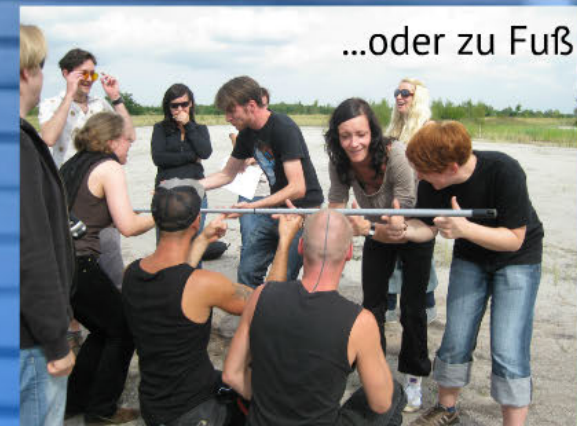
...oder zu Fuß